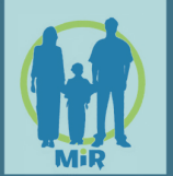
ሓገዝ ዝተሞሰ ካብ፡